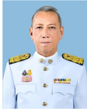
นายพิพัฒน์ รัชกิจประการ รัฐมนตรีว่าการกระทรวงการท่องเที่ยวและกีฬา (ประธานกรรมการกีฬาอาชีพ)