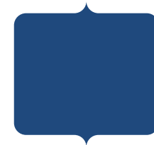
(ว่าง ลาออก) กีฬา..... ผู้แทนสมาคมกีฬาอาชีพ